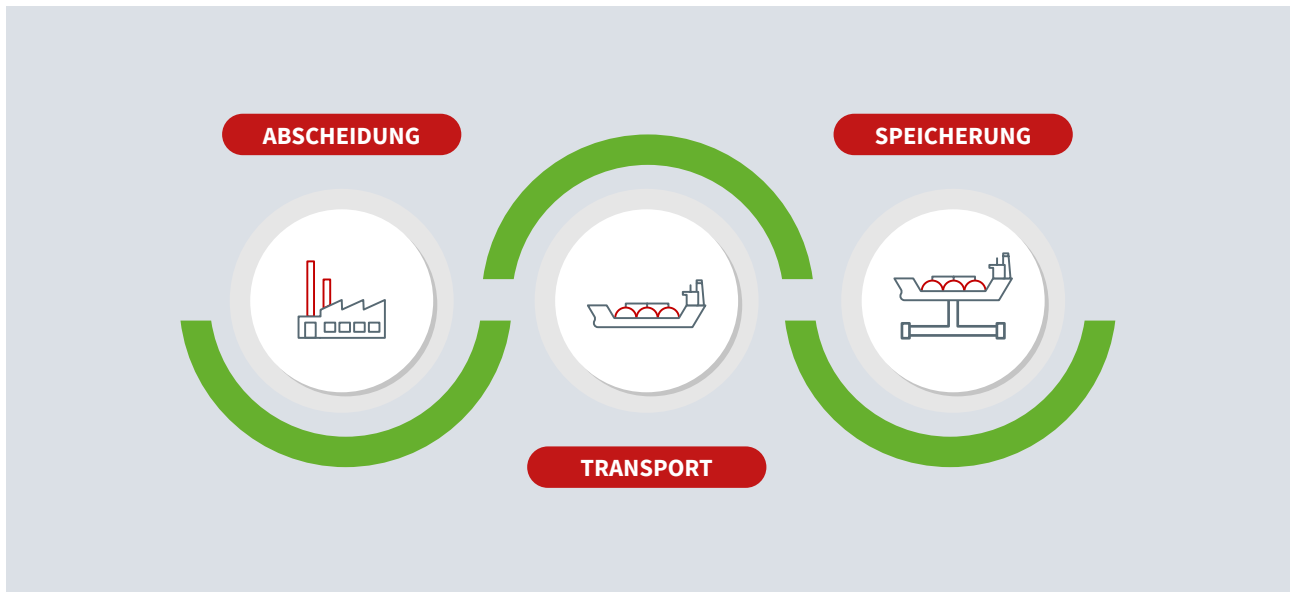
Die Aufbereitung von CO 2 .